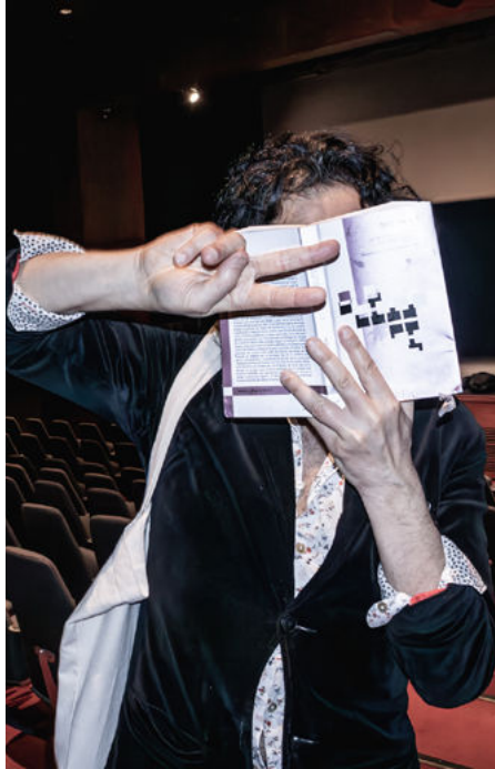
Sadin en Argentina. y una propuesta: “Ser actuantes, no esperar que las cosas vengan de arriba, parar de hablar todo el día expresando el rencor y el odio, construir a todas las escalas de la sociedad marcos colectivos”.

E sto adquirió un lugar doble. La primera relación con la palabra, en el marco político, son los representantes; inclusive hemos validado el hecho de que ser político es hacer discursos. Inclusive es solo hacer discursos. Es simplemente eso, el resto es acción convencional. En un momento uno dice: es tanto un discurso que no se corresponde con la realidad, que ese régimen de palabras en el or-