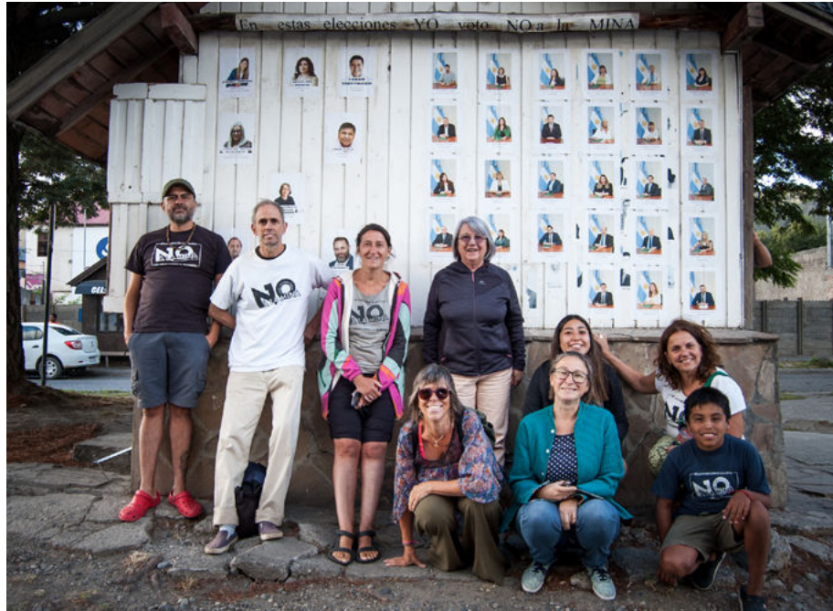
somos la única garantía”.