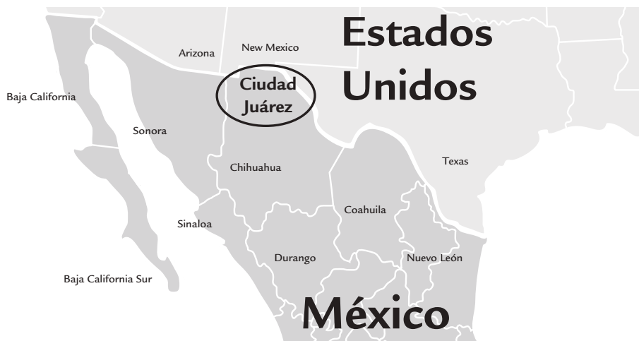
Mapa 1 Ciudad Juárez en la frontera México-Estados Unidos